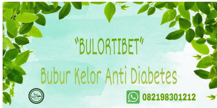
Gambar 2.1 Label kemasan BULORTIBET